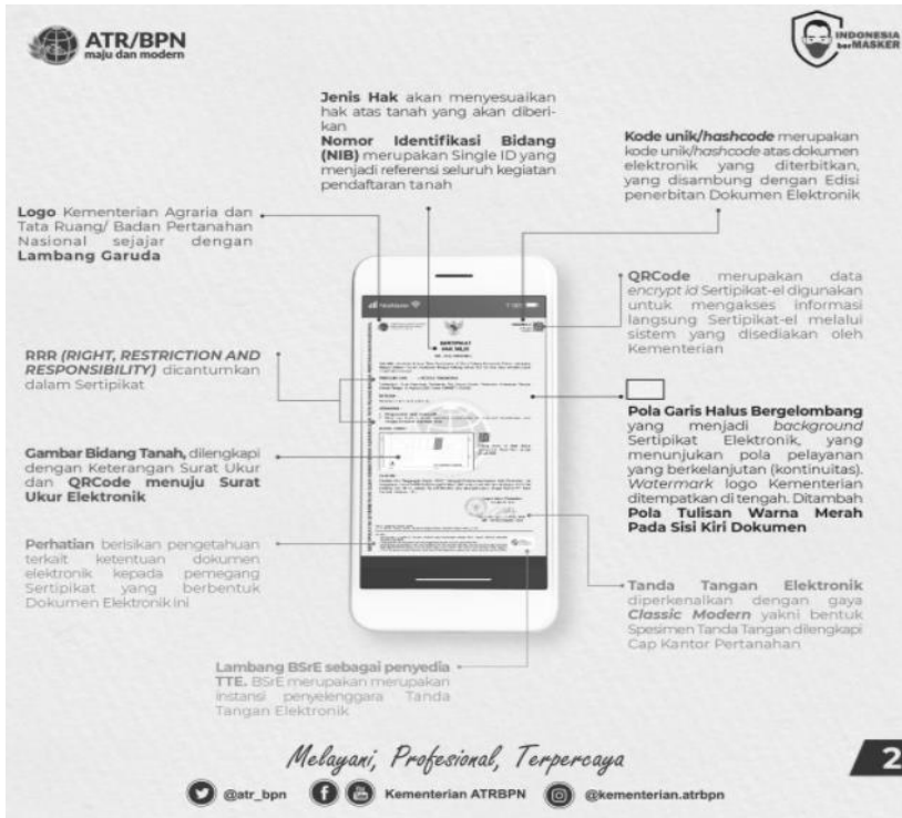
Gambar 5.2 Contoh Sertifikat Tanah Elektronik