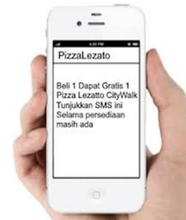
Gambar 7: Iklan di layanan pesan singkat (SMS)