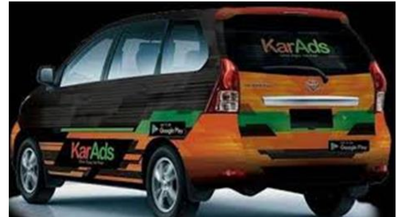
Gambar 12: Periklanan kolaboratif belakang mobil bermedia offline dan online