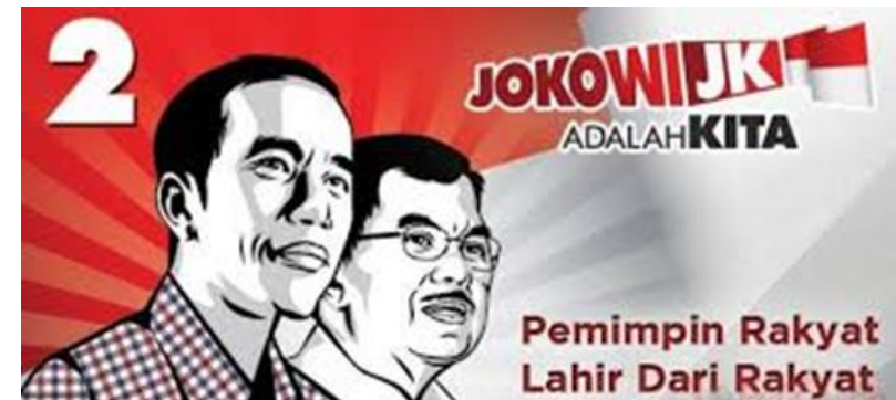
Gambar 8: Iklan politik jenis banner

decoder. Sampai dengan akhir era Orde Baru, jumlah televisi swasta membengkak menjadi lima stasiun televisi yaitu RCTI, TPI, SCTV, ANTV dan Indosiar, meski melarang iklan TVRI dengan alasan akan memicu konsumerisme, nyatanya iklan-iklan komersial menjadi kue yang diperebutkan secara bebas di televisi-televisi (Danial, 2009). Kini iklan-iklan komersial berkembang ke media-media online dengan beragam pesan dan format iklan yang tampil. Contoh iklan politik di bawah ini: