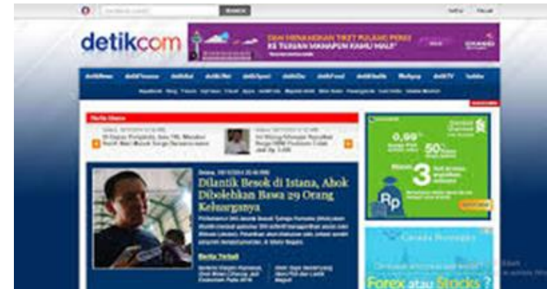
Gambar 14 (1-3 di atas): Iklan banner online di tiga web yang berbeda