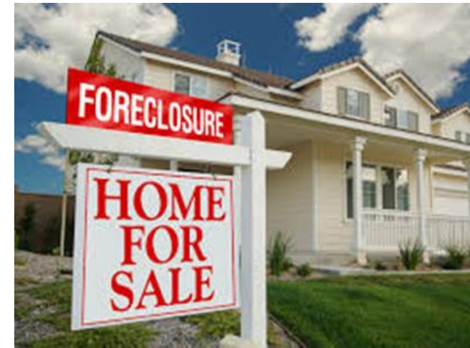
Gambar 11: Iklan pemasaran ( hard selling )

Hard selling adalah iklan yang secara langsung menjual produk ( product selling ). Iklan ini biasanya ditandai dengan tampilan gambar atau kemasan produk secara jelas dan terdapat kata-kata menjual. Contoh iklan hard selling sebagai berikut: