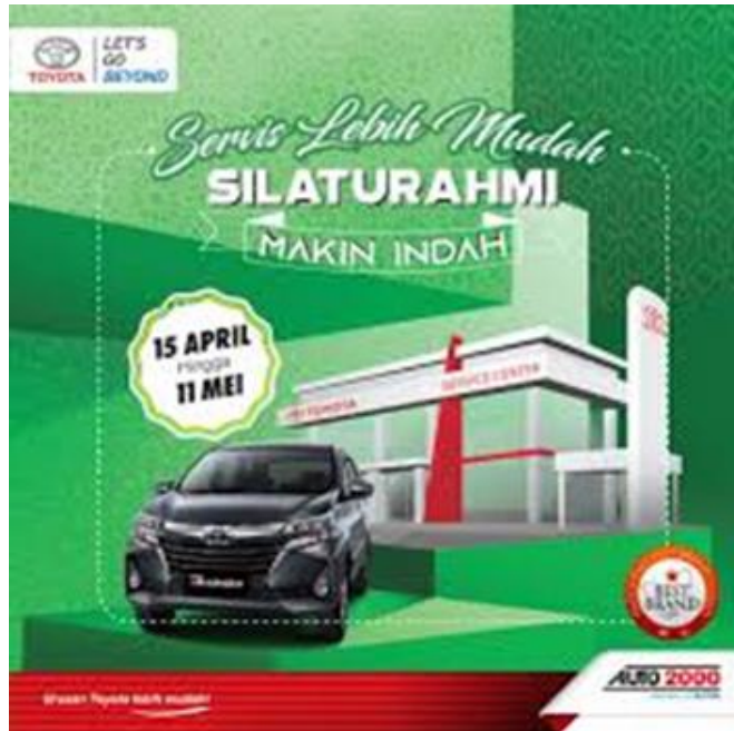
Gambar 10: Iklan korporat (Soft Selling)

Hard selling adalah iklan yang secara langsung menjual produk ( product selling ). Iklan ini biasanya ditandai dengan tampilan gambar atau kemasan produk secara jelas dan terdapat kata-kata menjual. Contoh iklan hard selling sebagai berikut: