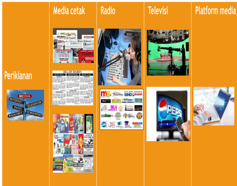
Gambar 3: Media dan platform periklanan (sumber penulis diolah dari buku dan google/internet)

Contoh iklan radio dan iklan menggunakan platform media Youtube bisa diakses pada link ini (tidak ada maksud untuk mempromosikan produk ini): https://www.youtube.com/watch?v=s9WAX9kC0SY Contoh iklan televisi dan iklan menggunakan platform media Youtube bisa diakses pada link ini (tidak ada maksud untuk mempromosikan produk ini): https://www.youtube.com/watch?v=y7LpM4OJ0Js