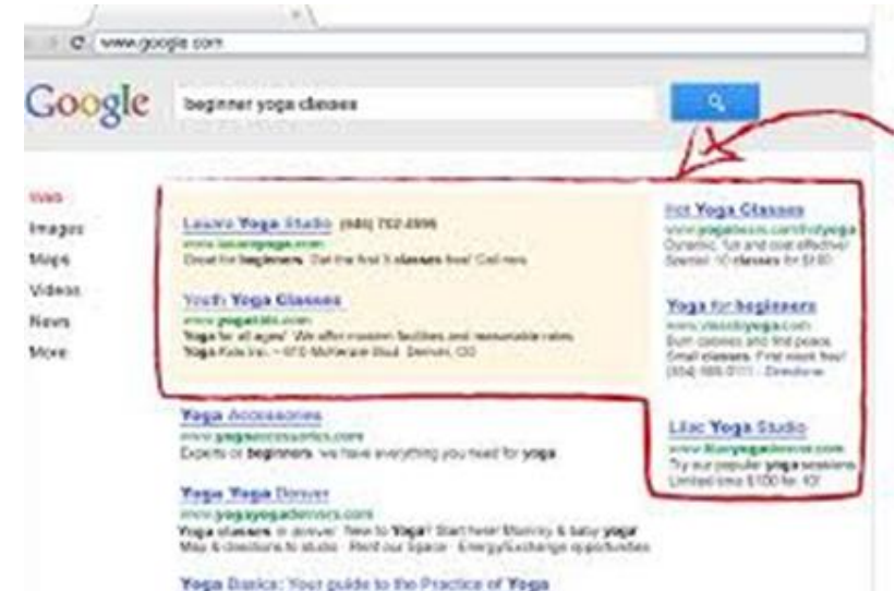
Gambar 15: Situs pencari iklan tanda panah

online yaitu (1) respons dari suatu iklan online dapat dengan mudah diukur bahkan dalam satu hari dengan menganalisis traffic web; (2) banyaknya informasi yang dapat diberikan dapat melebihi jumlah informasi yang dapat diberikan dari suatu kampanye iklan tradisional; (3) biaya untuk menjalankan kampanye iklan online lebih terjangkau dibandingkan melalui media tradisional (Onggo, 2008).