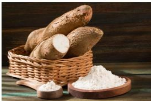
Gambar 3.1 Ubi Kayu

Ubi kayu merupakan umbi dengan kandungan pati yang cukup tinggi, banyak digunakan untuk industri tapioka dan turunannya. Ubi kayu segar mengandung air 60-70%, karbohidrat 12-33%. Selain itu terdapat juga komponen lain seperti protein, lemak, mineral dan serat dalam jumlah yang kecil. Kadar amilosa dari ubi kayu adalah 20-27%.