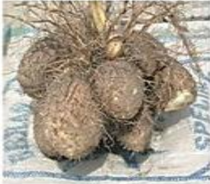
Gambar 3.2 Ubi Uwi