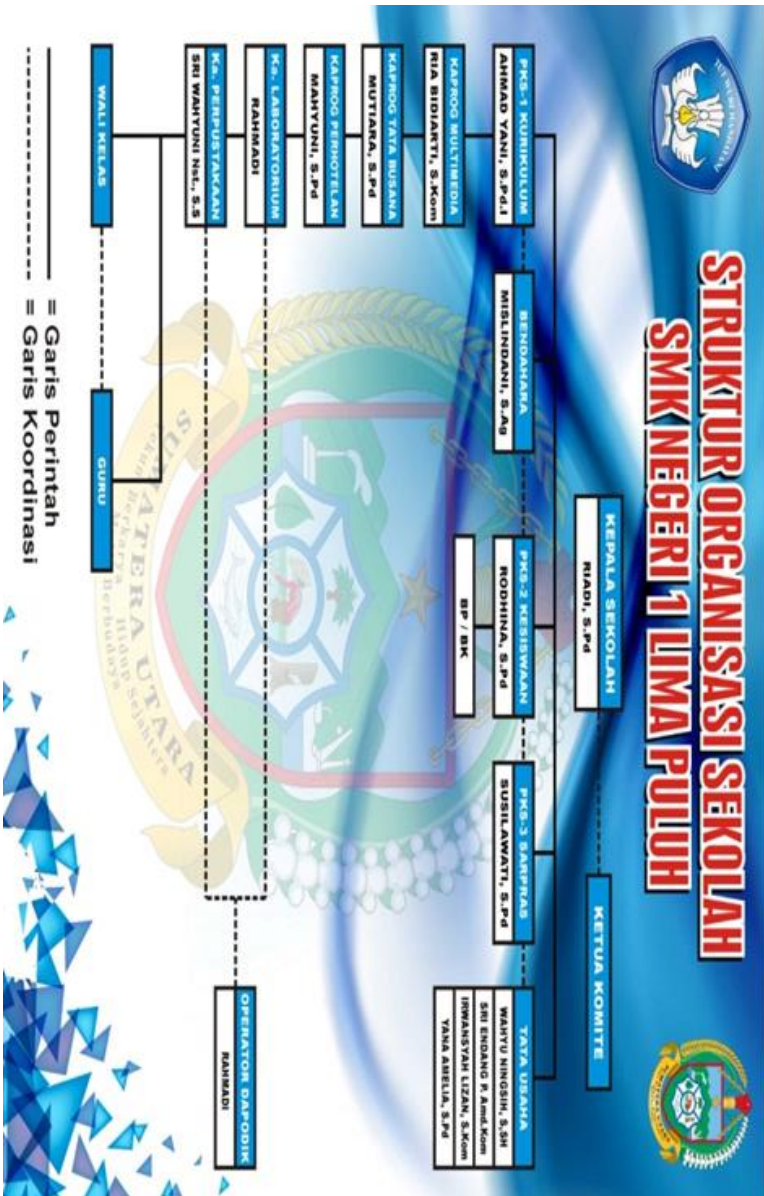
Gambar 6.1 Bagan Struktur Organisasi SMK Negeri 1 Lima Puluh