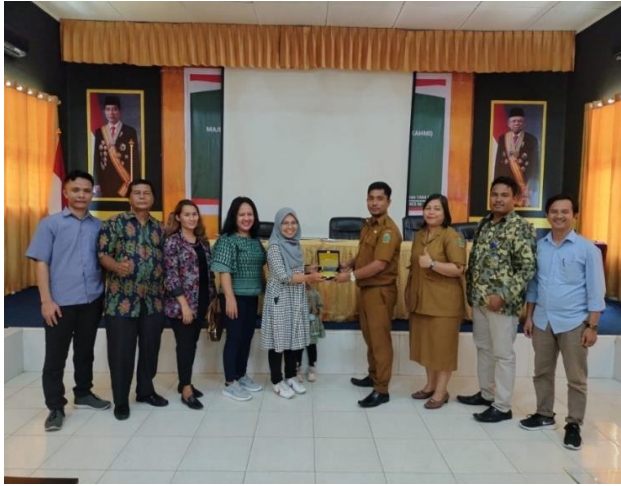
Gambar 7.3 Foto Penandatanganan MOU/MOA antara Pihak SMK Negeri 1 Lima Puluh dengan IDUKA

Berdasarkan gambaran yang disajikan, dapat terlihat bahwa pihak IDUKA dan SMK Negeri 1 Lima Puluh telah melakukan seremonial sebagai tindakan awal dalam menjalin kerjasama untuk pengimplementasian dan penerapan kurikulum merdeka di SMK tersebut. Seremonial ini mungkin mencakup berbagai kegiatan, seperti penandatanganan perjanjian kerja sama, penyampaian pidato atau presentasi, dan tindakan simbolis lainnya yang menunjukkan komitmen bersama untuk melaksanakan kurikulum merdeka.