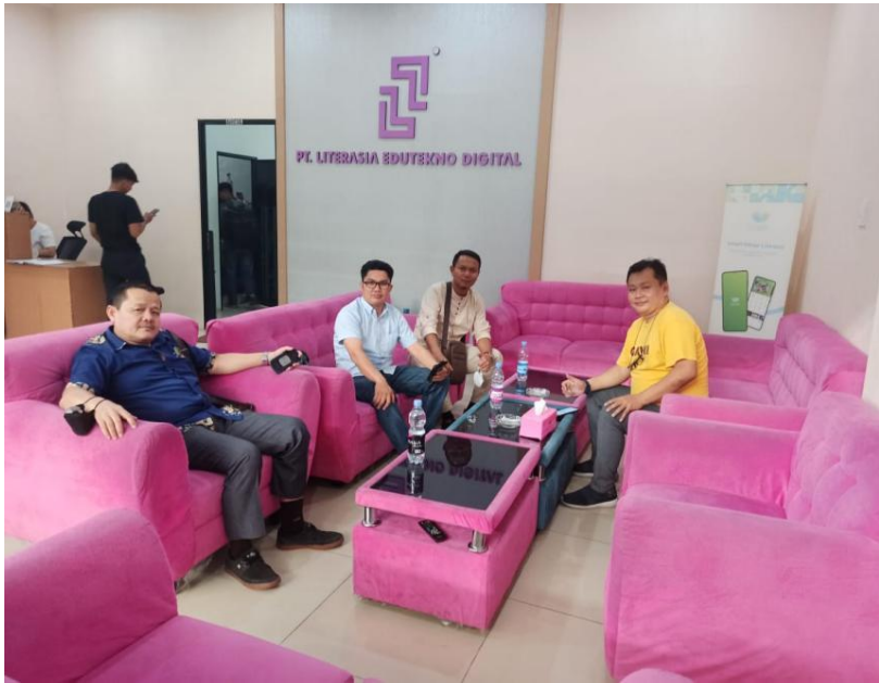
Gambar 7.2 Diskusi dengan Pelaku Usaha

Pada gambar tersebut, kepala sekolah dan beberapa guru melakukan komunikasi dan diskusi mengenai perkembangan dunia multimedia untuk merencanakan implementasi kurikulum merdeka yang terkait dengan teknologi tepat guna untuk kepentingan IDUKA, berdiskusi mengenai materi yang akan dipelajari, guru sedang menjelaskan materi dan modul yang digunakan siswa-siswi agar mampu beradaptasi dengan kebutuhan dan perkembangan teknologi yang nantinya diharapkan siswa mampu memahaminya dengan baik, sejalan dengan itu pelaku usaha juga menyarankan konsep materi yang relevan dengan kebutuhan dunia usaha saat ini, setelah itu barulah direncanakan untuk membuat formula yang tepat mendesain kurikulum yang terintegrasi dengan kebutuhan IDUKA.