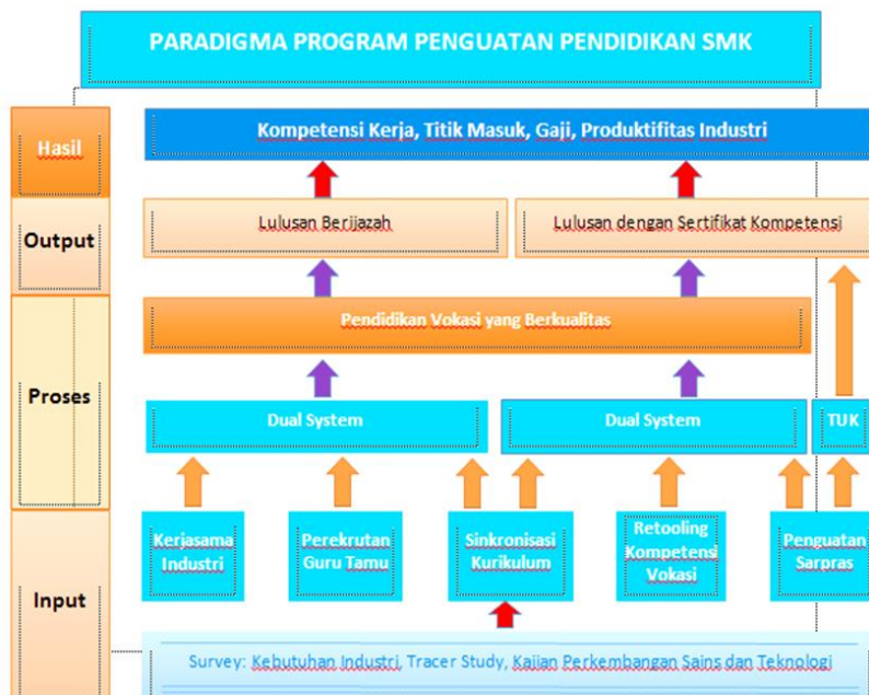
Gambar 7.1 Paradigma Program Penguatan Pendidikan SMK Diadopsi Dari Dirjen Vokasi

MENDIKBUDRISTEK menghadirkan kebijakan Merdeka Belajar dengan tujuan untuk meningkatkan sistem pendidikan di Indonesia, menjadikannya lebih fleksibel dalam menentukan arah dan tujuan pendidikan sesuai dengan latar belakang sekolah, baik di level SD, SMP, SMA sederajat, maupun di SMK atau sekolah kejuruan. Program Merdeka Belajar diharapkan dapat menciptakan siswa-siswa yang berjiwa Pancasila, memiliki karakter kebangsaan,